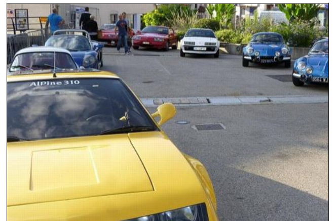
Le Berlinette Alpine club des Deux Savoie (bac2s) organise dimanche sa 2 e Ronde gaillardine. Seront au départ des alpines, bien sûr, mais aussi d'autres voitures sportives de légende. Il sera possible d'admirer tous ces bolides de 7h30 à 8h30, heure du départ de la ronde.