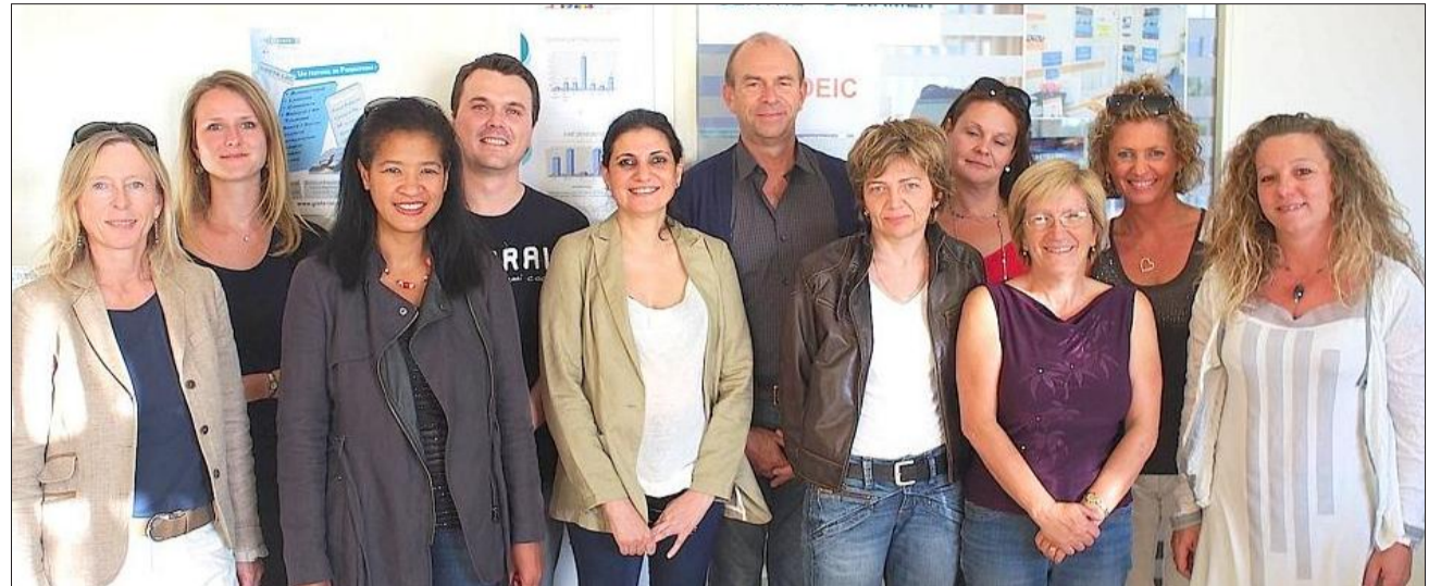
J.O. Les lauréats se sont vus remettre leur "Test of english for international communication", mardi soir dans les locaux du Greta.

Cette session d'apprentissage qui se déroule sur un an, un soir par semaine, est reconduite cette année. Le TOEIC, un diplôme internationalement reconnu, est un plus incontestable sur un CV pour une recherche d'emploi, en France et hors de nos frontières.