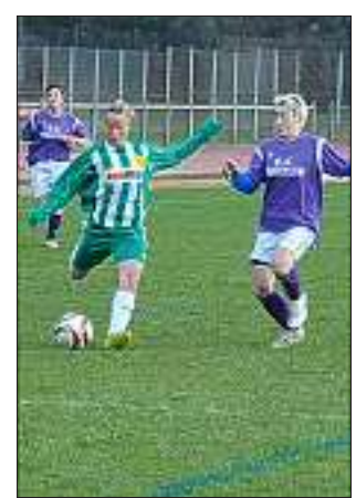
Le FCAF a fait la différence face à Boège en inscrivant trois buts.

Malgré le petit terrain de Boège, où se jouait ce week-end la qualification pour la Coupe de France des équipes de vallée verte et le club ambillien, la technique et l'opportunité du FCAF ont fait la différence.