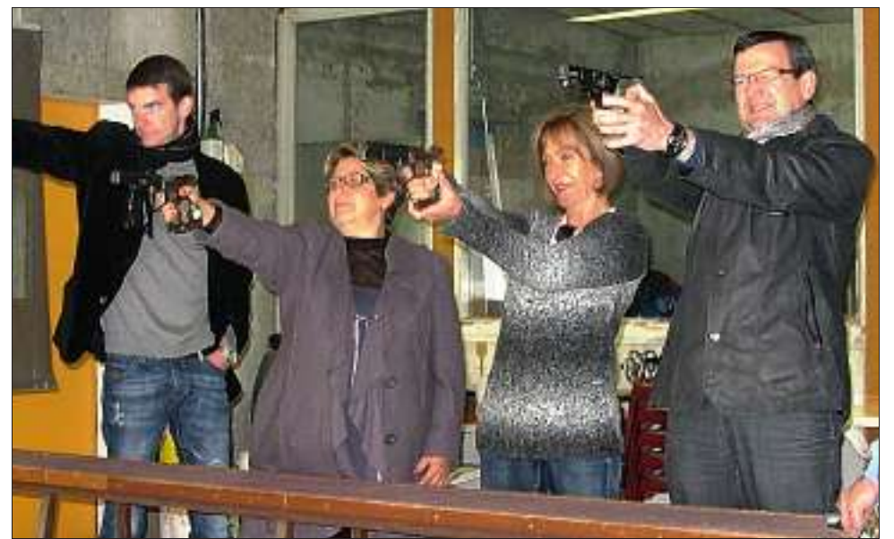
Les élus de l'agglomération, par équipe, se sont appliqués lors de cette compétition amicale.