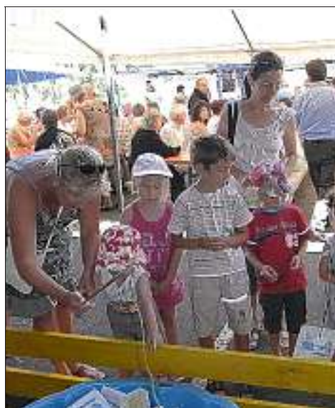
La pêche miraculeuse attire toujours autant d'enfants. Le DLM.-TR.

Vendredi soir, pour le feu de la Saint-Jean organisé par Anim'Esery, un repas canadien avait réuni 145 convives dans le Champ Canard. □