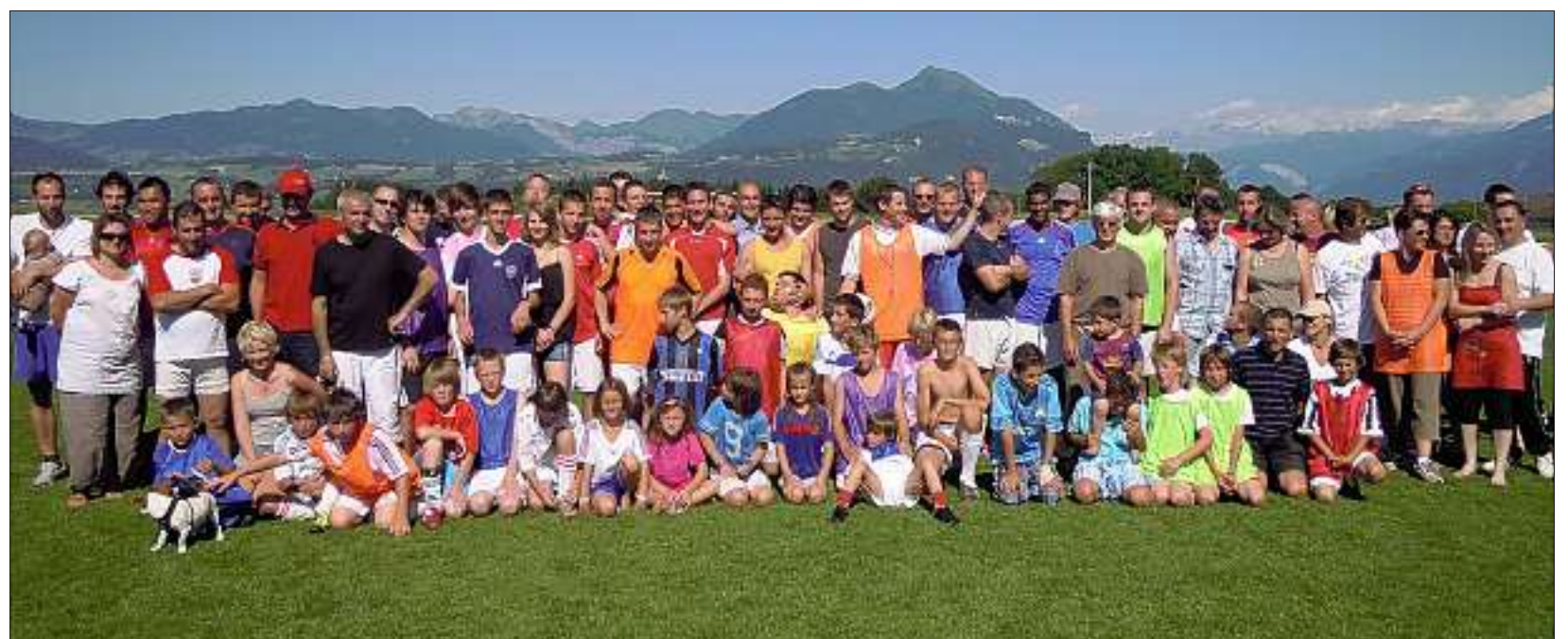
Tous les membres de l'US Pers-Jussy se sont réunis samedi au stade pour une journée football mettant un terme à la saison. Petits, grands, parents, dirigeants : ils étaient près d'une centaine à se retrouver pour un tournoi mixte toutes générations confondues. À l'image d'une saison sans soucis, l'ambiance était à la fête à l'heure du traditionnel repas clôturant la journée. Le DLM.-TR.