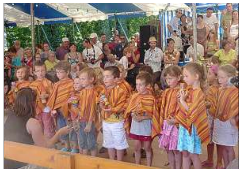
Le spectacle de fin d'année des enfants des écoles de la Colline a fait le bonheur des spectateurs. Le DLM.-TR.