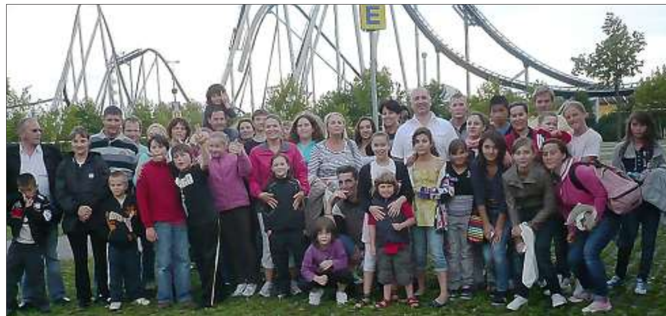
Une journée inoubliable de détente pour les jeunes compétiteurs du judo club de Gaillard.