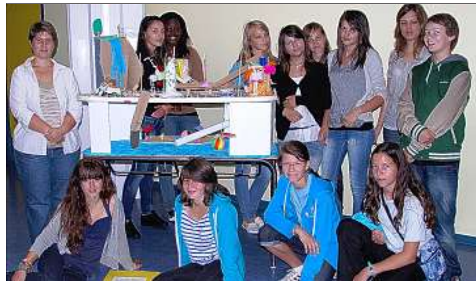
L'exposition d'arts plastiques des élèves de deux classes de 4 e .

Le collège Paul-Langevin a accueilli samedi, parents et futurs collégiens pour une visite guidée de l'établissement avec de nombreuses animations organisées par toute l'équipe pédagogique et les parents d'élèves. À l'auditorium, ils ont pu voir un conte musical, "Charlie and the chocolate factory", puis la remise des récompenses du projet "À vos marques prêts, créez", celle des diplômés de gestes de premier secours et des diplômés Certilang.