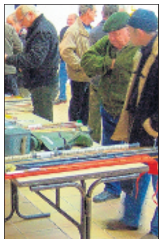
Il est temps de s'équiper pour l'ouverture le 12 mars !

C'est sûr, les pêcheurs y trouveront leur bonheur !