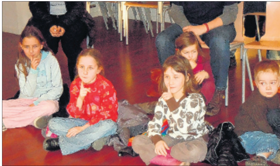
Les enfants, subjugués, veulent sauver Diabou des griffes du lion ! Le DL/PV