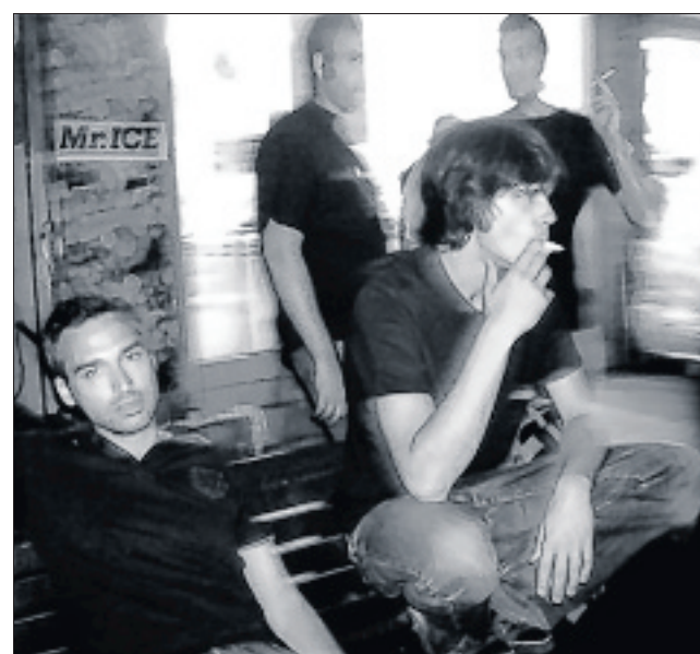
Swamp, l'affiche du mois, ce soir au Poulpe. Élevés au son du blues, pionniers du rock'n'roll et du punk des années 70, les quatre membres du Swamp délivrent leur message sonique à coups de riffs rageurs.

Au Poulpe, le mois de février a débuté mercredi avec une soirée jeux de sociétés avec Lémandragore, suivie le lendemain d'un concert avec Django & Bzer.