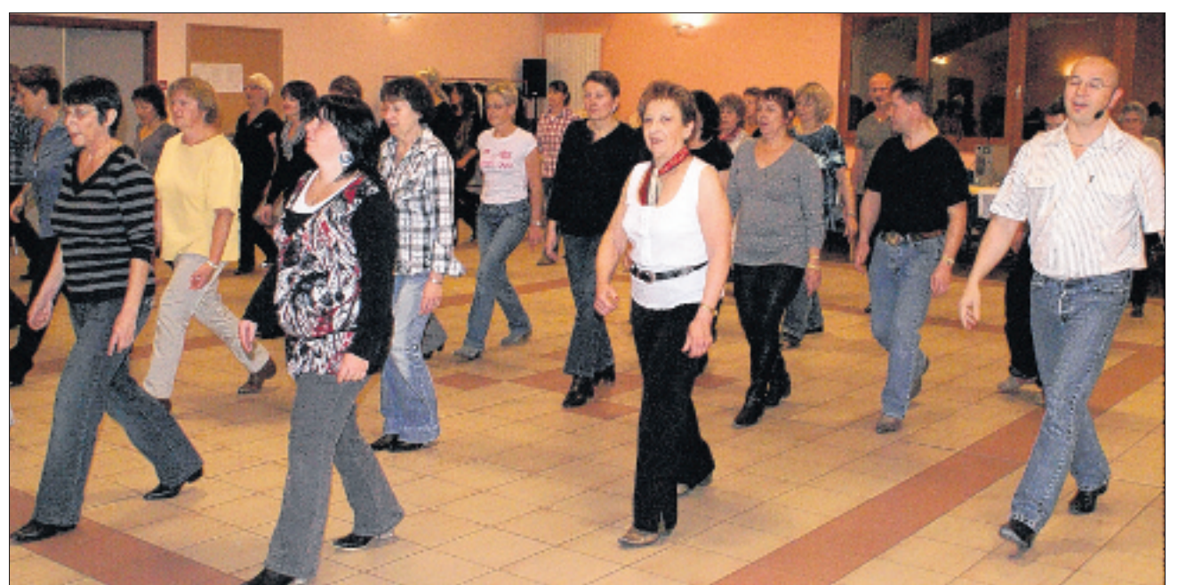
Humour, joie et fantaisie sont garantis pendant les cours. Le DL/GT